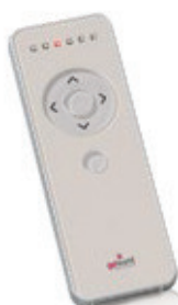
Comando 7 canais