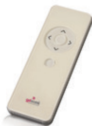
Comando 1 canal