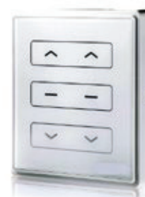
Comando mural via radio 2 canais