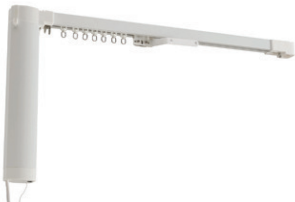
Sistema de Franzir