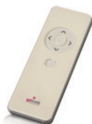
Comando 1 canal