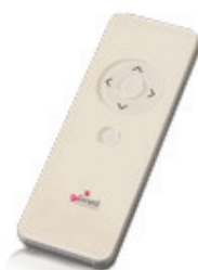
Comando 1 canal