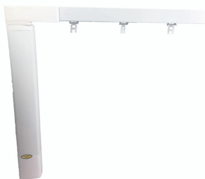
Sistema RDS (onda)