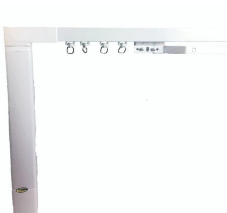
Sistema de Franzir