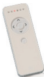
Comando 7 canais