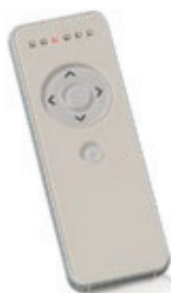
Comando 7 canais