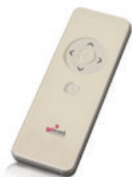
Comando 1 canal