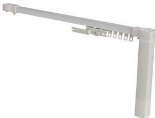
Sistema de Franzir