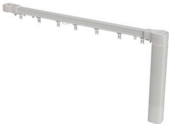
Sistema RDS (onda)