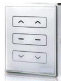
Comando mural via radio 2 canais