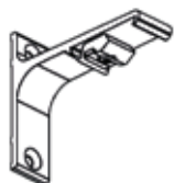
Suporte de Parede